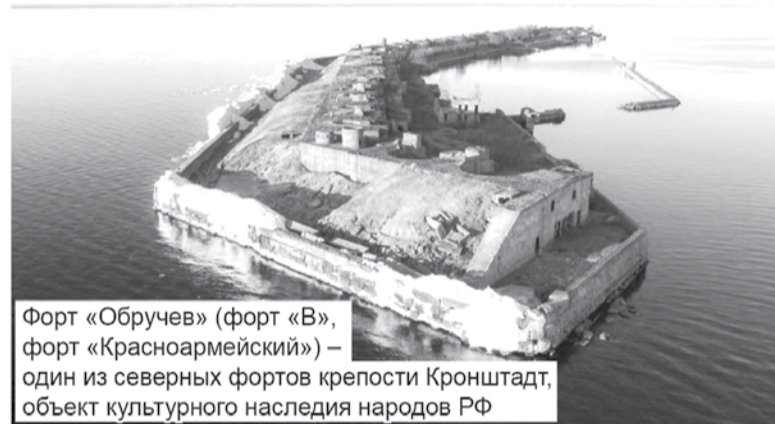
Форт «Обручев» (форт «В», форт «Красноармейский») – один из северных фортов крепости Кронштадт, объект культурного наследия народов РФ

С переходом войск Красной армии в наступление под Петроградом начались и боевые действия против финских войск, вторгнувшихся на советскую территорию (в районе между Ладожским и Онежским озёрами). Значительную роль в них сыграла Онежская военная флотилия, созданная в июне 1918 года и входившая в состав Балтийского флота.