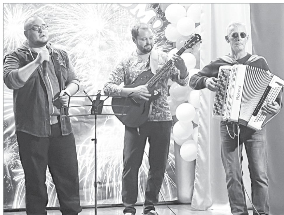
Творческий подарок от «VIM-студии»