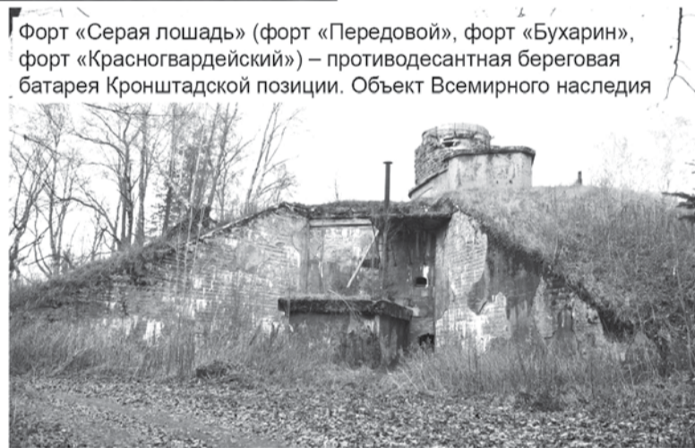
Форт «Серая лошадь» (форт «Передовой», форт «Бухарин», форт «Красногвардейский») – противодесантная береговая батарея Кронштадтской позиции. Объект Всемирного наследия